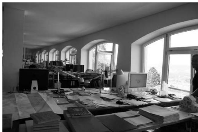
Büroräume der Firma TGG mit Blick auf die Stadt.