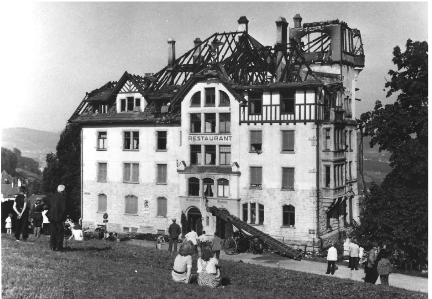
Der «Scheffelstein» nach dem Brand, 1943

Vom Restaurant konnte der Berichterstatter tröstlich vermelden: «Was den Restaurationsbetrieb anbelangt, kann mitgeteilt werden, dass er keinen Unterbruch erleiden wird, da die Wirtschaftsräume (Stube, Saal und Küche) intakt geblieben sind. Die Terrasse wird sofort freigeräumt werden und steht wohl in kurzer Zeit dem Publikum wieder zur Verfügung.»