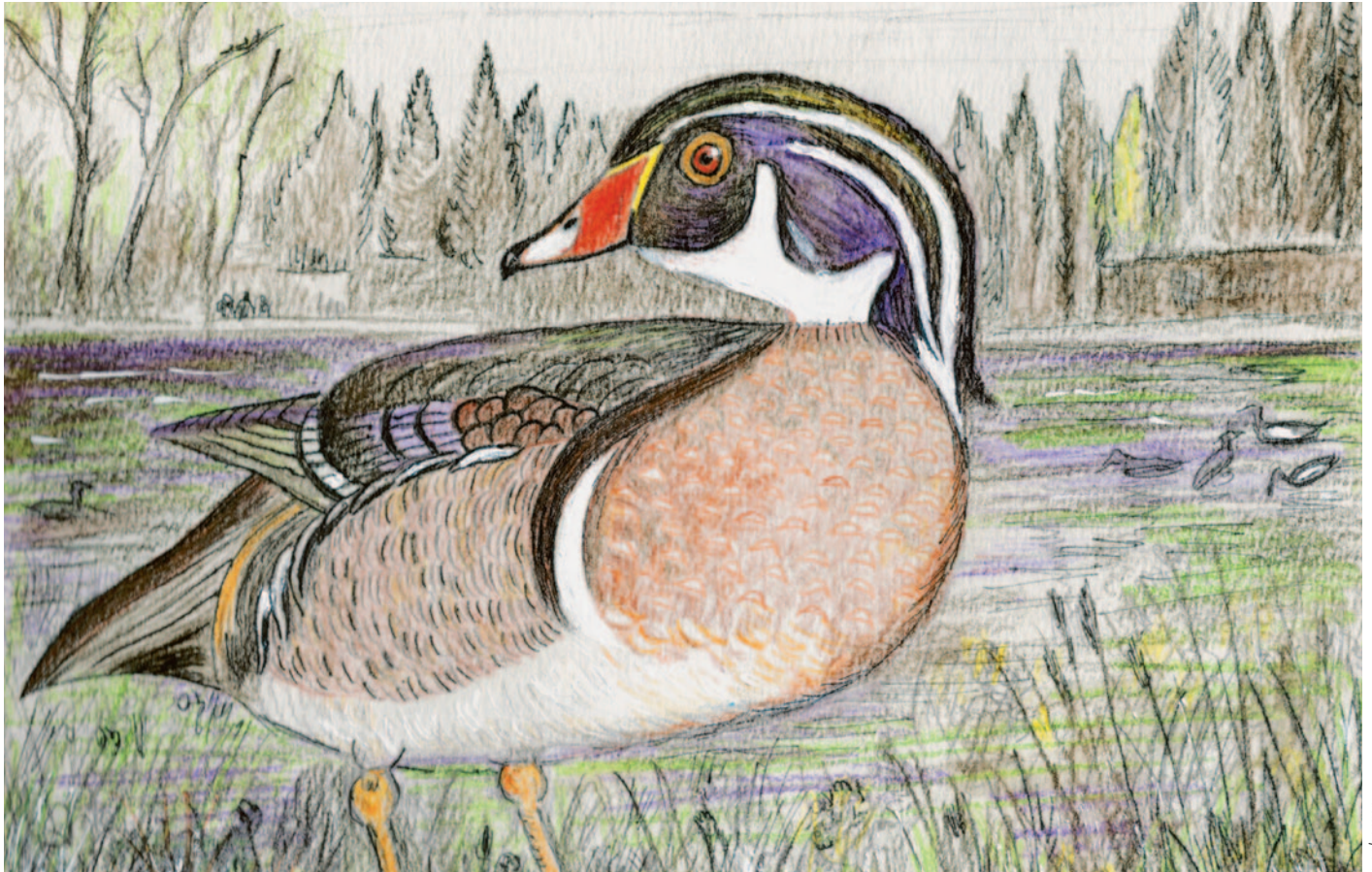
Zeichnung: Curt Leuenberger

Naturfilmer Sepp Keller aus Herisau zeigt «Wunder Natur in vier Jahreszeiten», anschliessend an die Hauptversammlung.