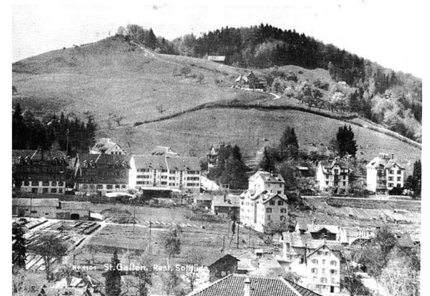
Die «Solitüde» zu einer Zeit, als es noch kein «Oberhofstetten», keine Pfister-Blöcke, kein Schulhaus und keine Kirchen Riethüsli gab, sonder noch die Gärtnerei Buchmüller existierte.

(Das Aussichtsrestaurant «Solitüde», um 1889 eröffnet, wurde 1990 geschlossen; für das in der Liste ebenfalls erwähnte Restaurant «Säntis» wurden keine Belege gefunden. Wir danken an dieser Stelle