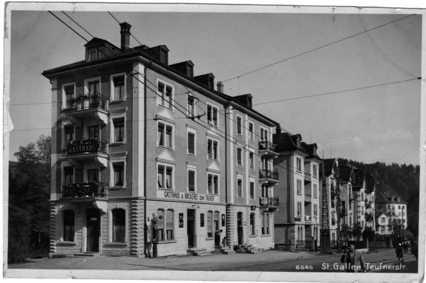
Gasthaus und Bäckerei zum Talhof, 1933.

«Riethäusle» hatte einst sechs Gaststätten», berichtete das Magazin fürs Nest im August 2009 voller Stolz. Nun stellt sich heraus, dass diese Zahl leicht untertrieben war. Aufgrund verschiedener Hinweise aus der Leserschaft ist unsere Liste ehemaliger Einkehrmöglichkeiten im Quartier auf über das Doppelte angewachsen: auf genau 13 Restaurants (von denen allerdings nur drei übrig geblieben sind). Alt Stadtarchivar Ernst Ziegler ist den Hinweisen nachgegangen und wirft einen Blick auf die Beizen und das übrige Leben im Riethüsli vor hundert Jahren.