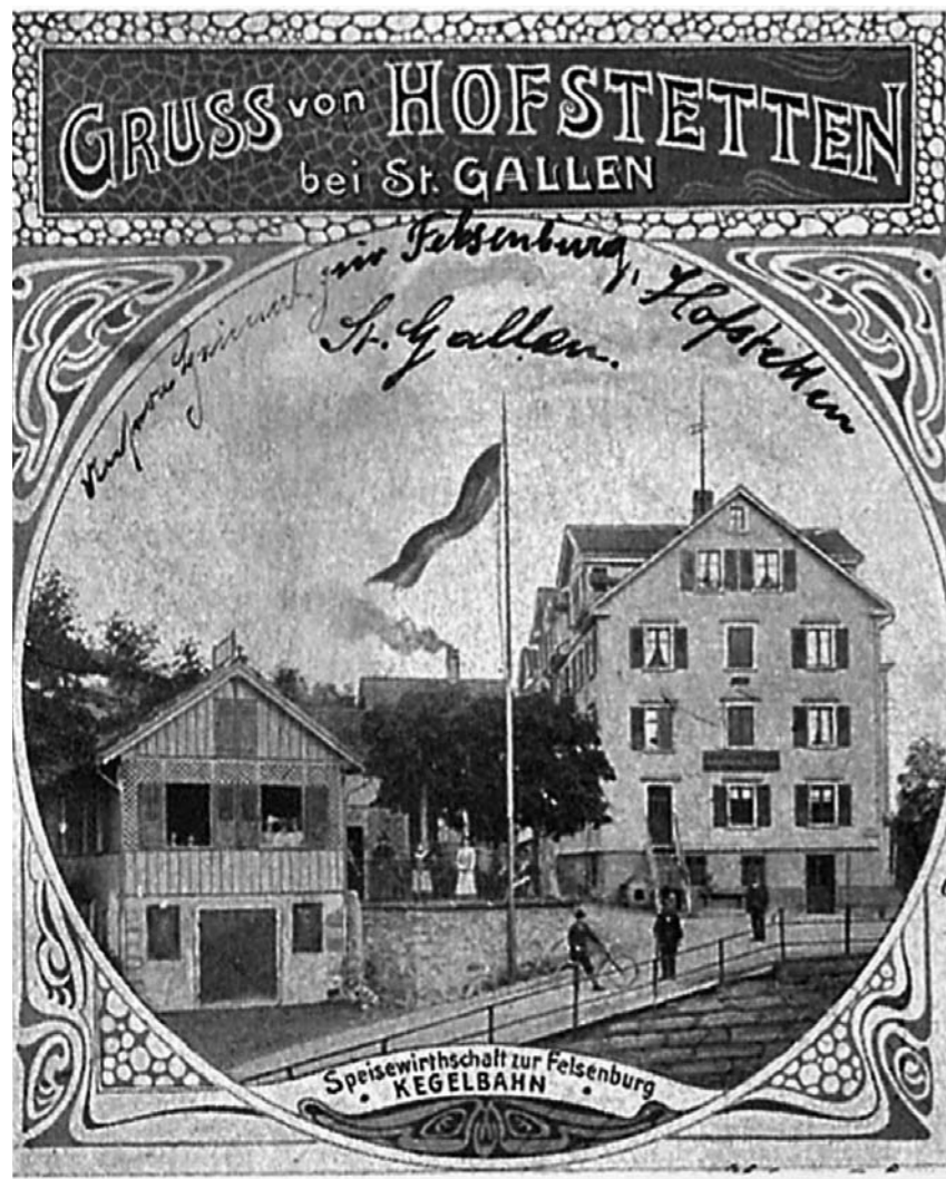
Restaurant Felsenburg, um 1910.